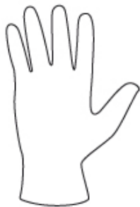
INDOSSARE UN GUANTO MONOUSO