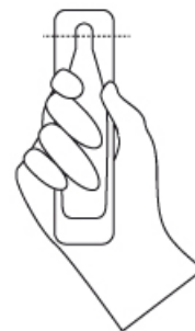
TAGLIARE SEGUENDO IL SEGNO TRATTEGGIATO